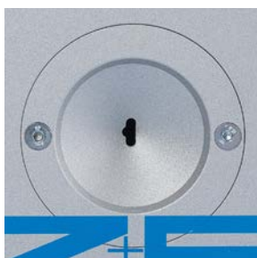
Spezialeinführtrichter Special feeding funnel

A two or a three wire conductor stripped with the AI 02 S3 in just one step.