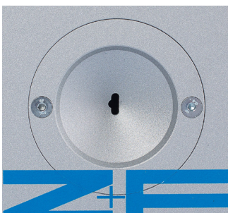
Spezialeinführtrichter Special feeding funnel

A two or a three wire conductor stripped with the AI 02 S3 in just one step.