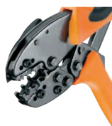
Crimpit IT 6 S