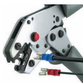
Crimpit IT 2,5 L

For processing terminals and connectors (details on page 113):